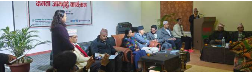
मानवअधिकारवादी, कानुनविद, उपभोक्ता हित संरक्षण कर्मि, विभिन्न संघसंस्थाका प्रतिनिधिहरुको सहभागितामा व्यवसाय र मानव अधिकारको कार्य योजनाको कार्यन्वयन सम्बन्धी छलफल कार्यक्रम