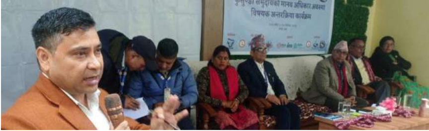
कसुण्डा समुदायको मानव अधिकार अवस्था विषयक अन्तरक्रिया कार्यक्रम