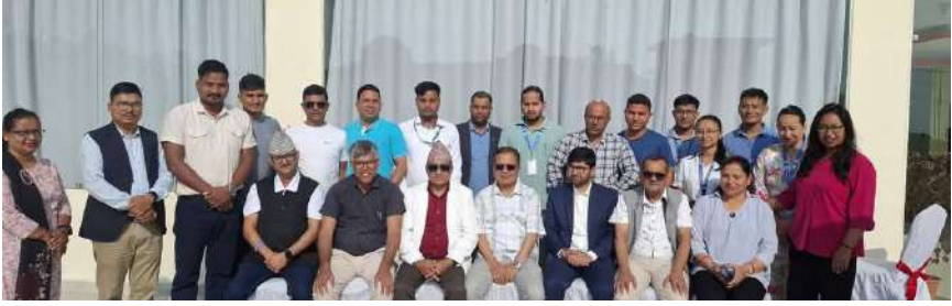
राष्ट्रिय मानव अधिकार आयोगको २५ औं वार्षिकोत्सव तथा २६ औं स्थापना दिवस २०८२ जेठ १३ गते राष्ट्रिय मानव अधिकार आयोग लुम्बिनी प्रदेशद्वारा आयोजित विशेष कार्यक्रम