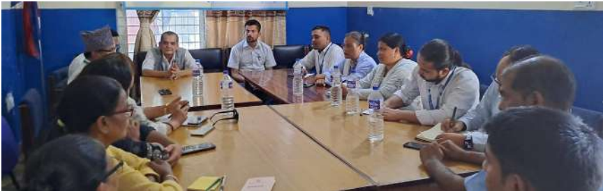
मानव अधिकारका समसामयिक विषयमा नागरिक समाज र मानव अधिकारकर्मीहरू सँग छलफल कार्यक्रम