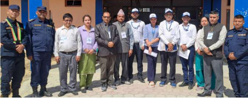
National Human Rights Commission of Nepal – NHRC, Nepal / UNFPA Nepal को संयुक्त आयोजनामा मिति २०८१ चैत्र १२ देखि १४ गते सम्म धनगढीमा सञ्चालित Sexual and Reproductive Health and Rights (SRHR) विषयक प्रशिक्षण कार्यक्रममा राष्ट्रिय मानव अधिकार आयोगका कर्मचारीहरु