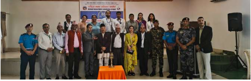
काठमाडौं स्कूल अफ ल का चौथो वर्षका विद्यार्थीहरू राष्ट्रिय मानव अधिकार आयोग, लुम्बिनी प्रदेश कार्यालय, बुटवलमा शैक्षिक भ्रमणका क्रममा सिचिपका केही भलकहरू।