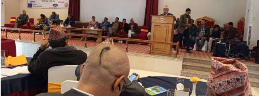
लुम्बिनी प्रदेश स्तरीय नागरिक सम्मेलन २०८१ मा नागरिक संघ संस्थाका चुनौती र नागरिक स्वतन्त्रता सम्बन्धी सम्वाद कार्यक्रम