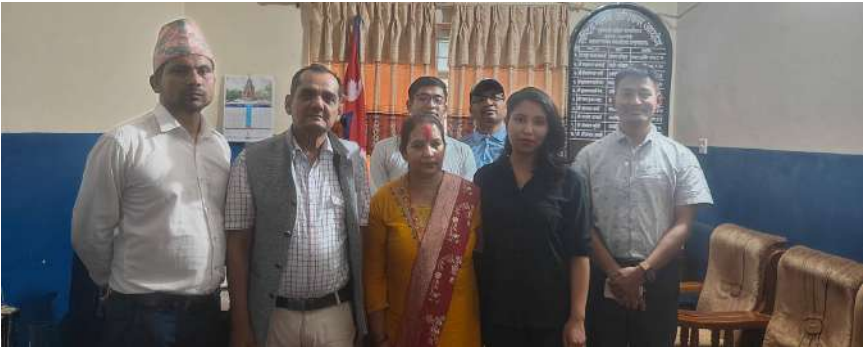
मिति २०८२ जेठ १ र २ गते राष्ट्रिय मानव अधिकार आयोगको केन्द्रीय कार्यालयको आयोजनामा तेस्रो त्रैमासिक समीक्षा कार्यक्रम