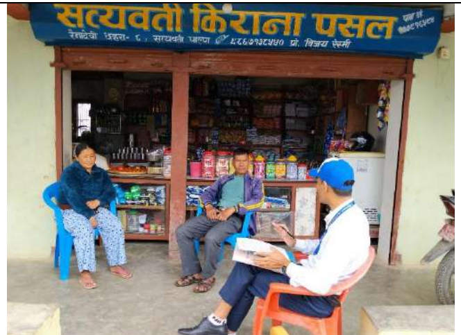
रैनादेवि गापा पाल्पाका मतदातासँग आयोगको कर्मचारी ।