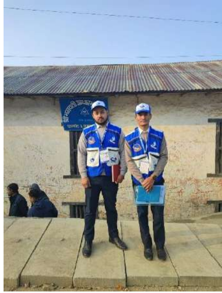
मतदान स्थल भगवती आधारभुत विद्यालय गुल्मी र आयोगको कर्मचारीहरु