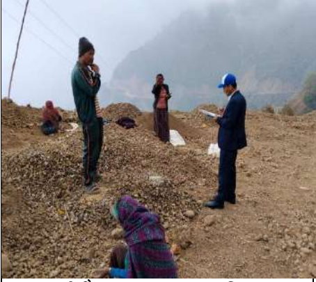
पाल्पाको रैनादेवी छहरा स्थित गिट्टी कुट्ने मजदुरहरूसँग निर्वाचनको विषयमा जानकारी लिँदै आयोगको कर्मचारी ।