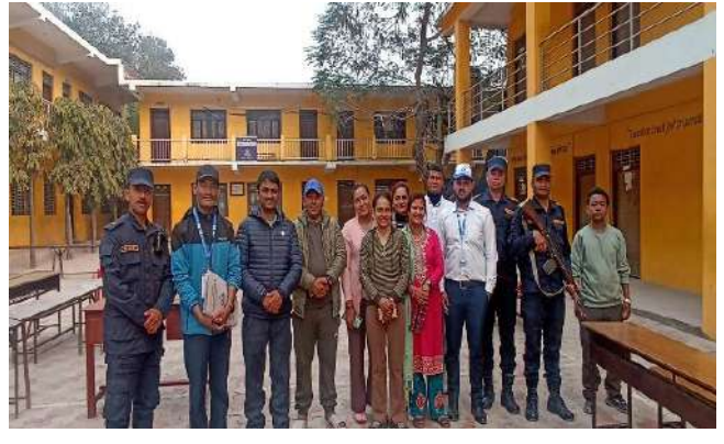
अर्घाखाँची जिल्ला छत्रदेव गाउँपालिका स्थित चन्द्र माविमा निर्वाचनमा खटिएको कर्मचारी दायौं । बायाँ गुल्मी जिल्लाको रिडि मावि मा निर्वाचनका लागि खटिएका कर्मचारीका साथ निर्वाचन पूर्वको अवस्थाका विषयमा जानकारी लिँदै आयोगको कर्मचारीहरु ।