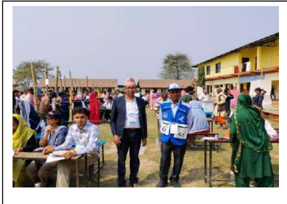
राष्ट्रिय माध्यमिक विद्यालय विनयी त्रिवेणी गाउँपालिका नवलपरासी(बर्दघाट सस्ता पश्चिम)