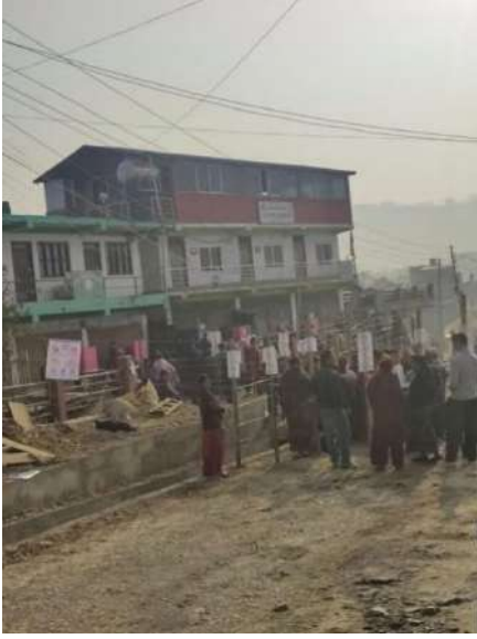
गुल्मीको प्रतिनिधि सभा सदस्य निर्वाचन २०८२ का ४ नं वडा कार्यालय गुल्मी दरवार गाउँपालिका