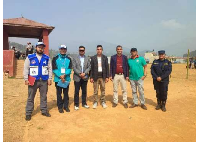
बालमन्दिर सन्धिखर्क अर्घाखाँचीमा खटिएका कर्मचारी र आयोगको कर्मचारीहरु ।