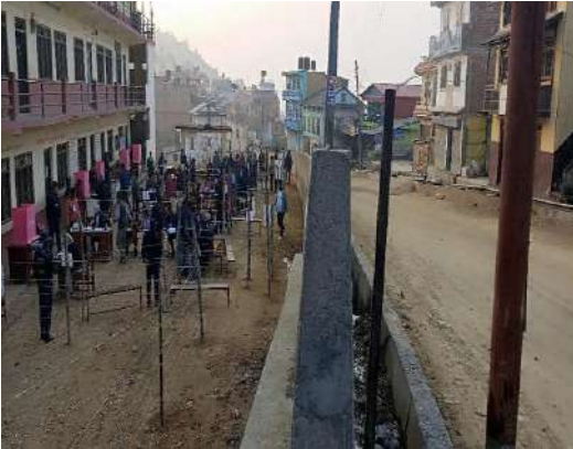
गुल्मीको प्रतिनिधि सभा सदस्य निर्वाचन २०८२ का दिन ज्ञवा बलेटक्सार मावि मतदान केन्द्र