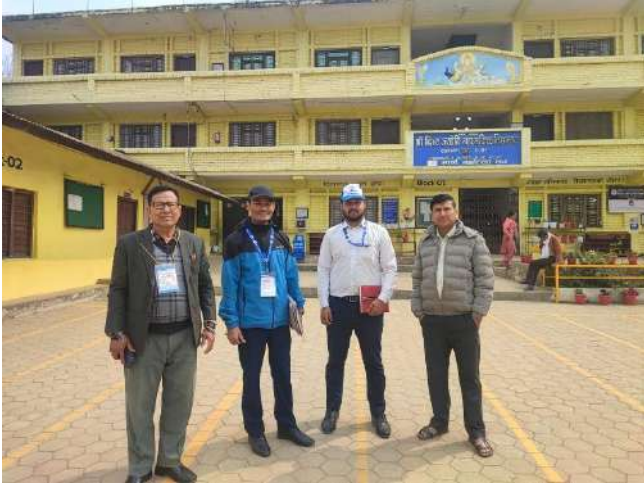
दिव्यज्योती मावि पाल्पा क्षेत्र नं १ मा खटिका कर्मचारी र आयोगको कर्मचारीहरु ।