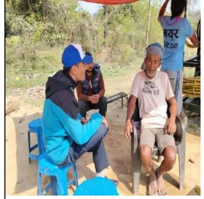
नवलपरासी (बर्दघाट सुस्ता पश्चिम) मा मतदातासँग कुरा गर्दै आयोगको कर्मचारीहरु ।