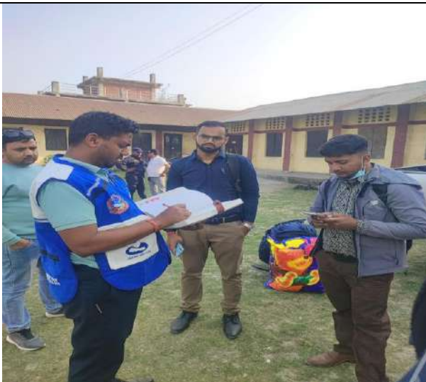
जनता मावि सरावल ६ कुसौलीमा खटिएका कर्मचारीहरूसँग आयोगको कर्मचारीहरु