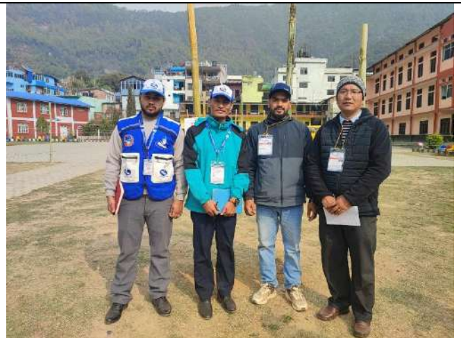
महेन्द्र मावि रेसुङ्गा नपा मा खटिएको कर्मचारी र आयोगको कर्मचारीहरु ।