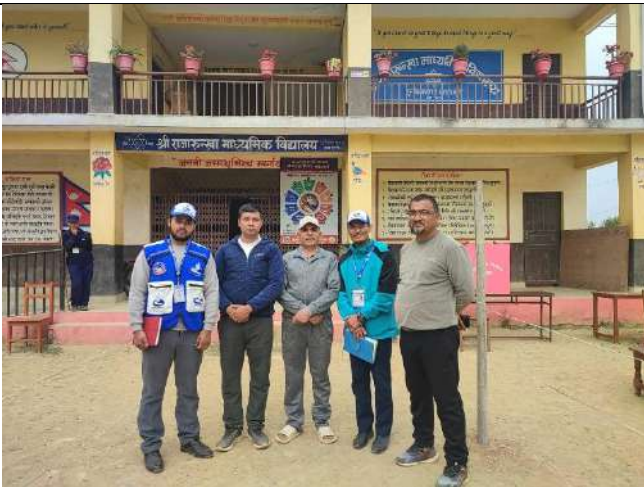
राजारुखा मावि गुल्मीमा खटिएका कर्मचारी र आयोगको कर्मचारीहरु ।